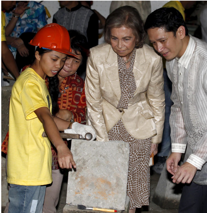
SM la Reina atiende a las explicaciones de una joven filipina, durante su visita a una escuela taller financiada por España en Manila, durante su visita en julio de 2012.

Finalmente, España mantiene en Filipinas una importante cooperación al desarrollo, centrada en derechos humanos, gobernanza y en la reducción de riesgos de desastres.