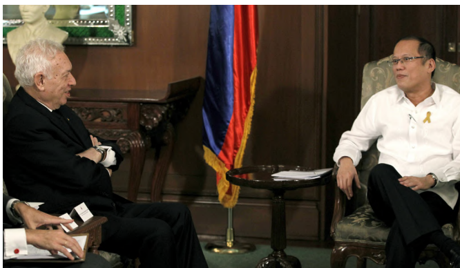
El anterior ministro de AA.EE y de Cooperación José Manuel García-Margallo, durante el encuentro con el entonces presidente de Filipinas, Benigno Aquino, celebrado en Manila en marzo de 2014.

tas circunscripciones del país (229 escaños) y el proporcional, mediante listas de partidos en circunscripción única (55 escaños). La Constitución establece que el 20% de los miembros de la Cámara formen parte de la lista de un partido de circunscripción única. Estos partidos han de representar un interés sectorial, profesional, rural, pobres urbanos, comunidades culturales indígenas, jóvenes, mujeres, y otros sectores que puedan ser definidos por ley.