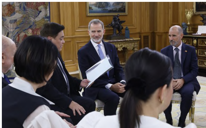
Audiencia de S.M. el Rey a una delegación de Senadores filipinos.- Palacio de La Zarzuela.-Madrid, 23.10.2023.

nes de USD. Le siguieron el aceite de coco con una disminución anual de 920,58 millones de USD, y otros productos minerales con una disminución anual de 716,30 millones de USD.